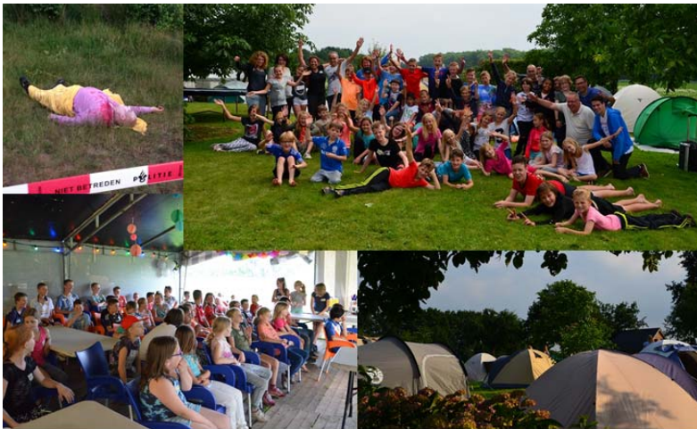
JEUGDKAMP 25 JUNI 2016