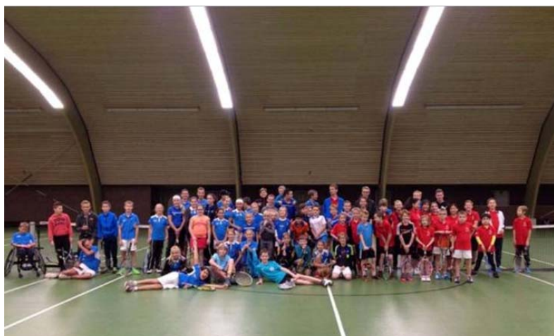
VLTC VS DE KORREL 13 NOVEMBER 2016 / VLTC WINT!