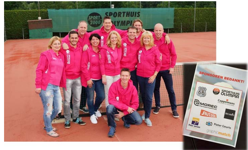
SPORHUIS OLYMPIA OPEN DUBBEL TOERNOOI