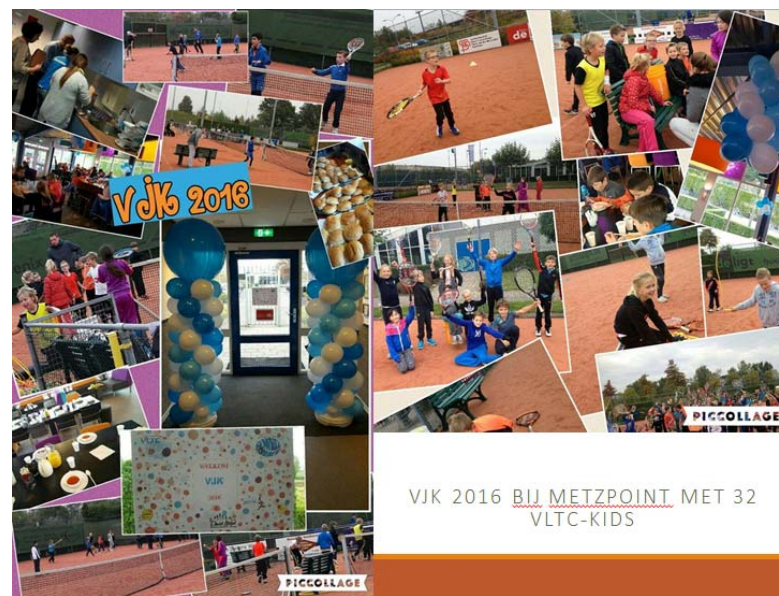
VJK 2016 BIJ METZPOINT MET 32 VLTC-KIDS