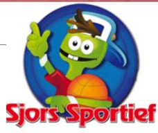
> 40 BASISSCHOOLKINDEREN MAKEN KENNIS MET TENNIS