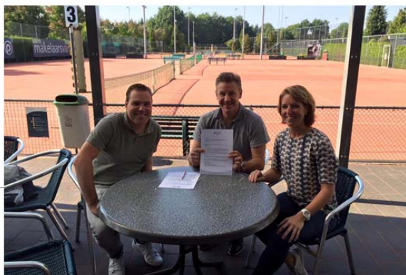
VERLENING CONTRACT SPORTIVITY SERVICE