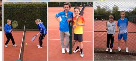
1 E TULPENTOERNOOI SAMEN MET DE KORREL